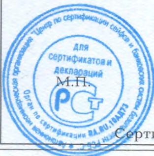
Схема сертификации - 1с